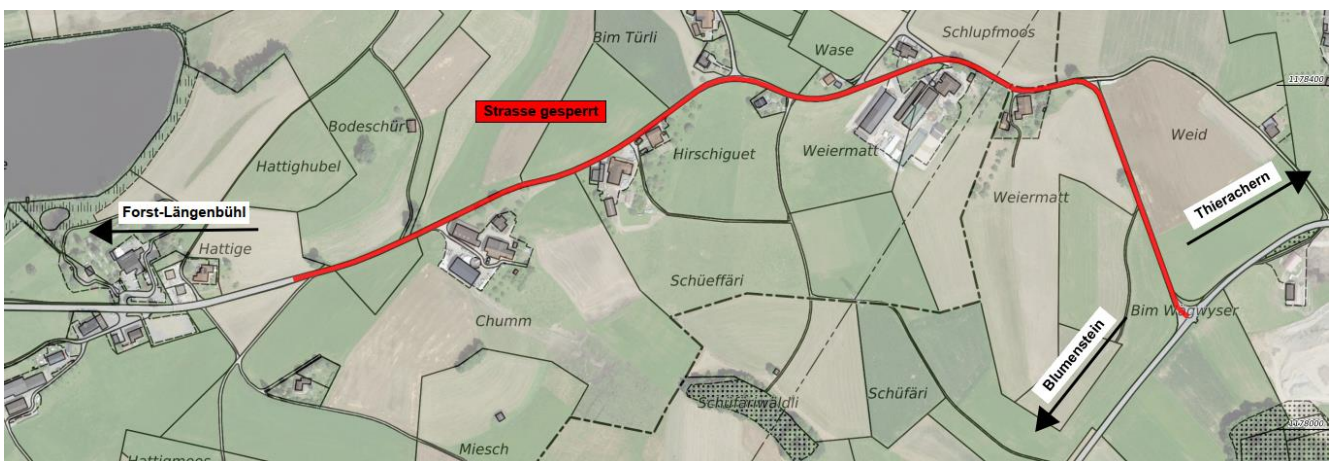
Abbildung 1: Übersicht

Die Umleitungen werden ausgeschildert. Für Zufussgehende ist der Abschnitt unter Einschränkungen begehbar. Von der Sperrung ist auch der ÖV betroffen, die konkreten Auswirkungen entnehmen sie den Informationen auf der Rückseite.